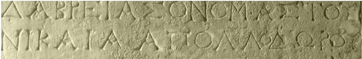
Section of Greek and Roman Antiquity SGRA

Τομέας Ελληνικής και Ρωμαϊκής Αρχαιότητας ΤΕΡΑ